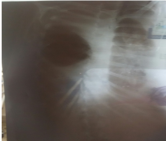
تصویر ۱ - وضعیت ریه بیمار قبل از درمان

ثبت شد. در بررسی‌های آزمایشگاهی شاخص متوسط حجم گلبولی ۱ برابر با ۷۶/۵، هماتوکریت ۲ برابر با ۳۱/۶، هموگلوبین ۳ برابر با ۱۰/۴، اوره ۴ برابر با ۲۰، پروتئین ۵ برابر با ۳ و آلبومین ۶ برابر با ۲/۴ مشاهده گردید. بعد از انجام بررسی‌های آزمایشگاهی و ریوی (تصویر ۱)، تشخیص شیلو تورا کس بیمار قطعی و چست تیوب جهت بیمار تعبیه گردید. در مرحله بعد بیمار تورا کوتومی و در وضعیت پوسٹرو لترال فضای ۶ بین دنده‌ای باز و پس از ساکشن محل، چسبندگی‌ها آزاد و مجرای تورا سیک با پلجت سوچور گردید. بیمار به مدت ۴ روز در بخش مراقبت‌های ویژه بستری و سپس با حال عمومی خوب به بخش تورا کس منتقل و در نهایت با وضعیت عمومی طبیعی از بیمارستان ترخیص گردید (تصویر ۲).