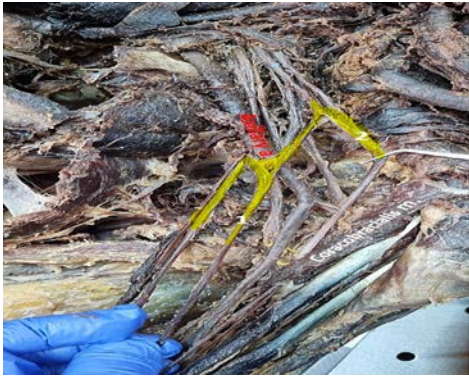
شکل ۱: شکل گیری عصب مدین. عصب مدین (۱)، عصب موسکولوکوتانئوس (۲).

بازو به سمت حفره کوبیتال نزول کرده است، اما عصب مدین با عصب موسکولوکوتانئوس بعد از عبور عضله ی کوراکوبرکیالیس یک شاخه ی ارتباطی دارد (شکل ۱ و ۲).