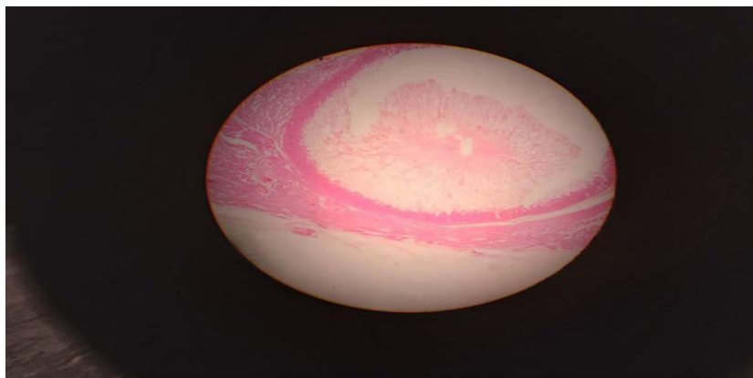
شکل ۲: نمونه ضایعه هیستولوژیک نمونه سارکوسیستیس جدا شده از بافت ماهیچه ای از شهر اسفراين ۱۴۰۱